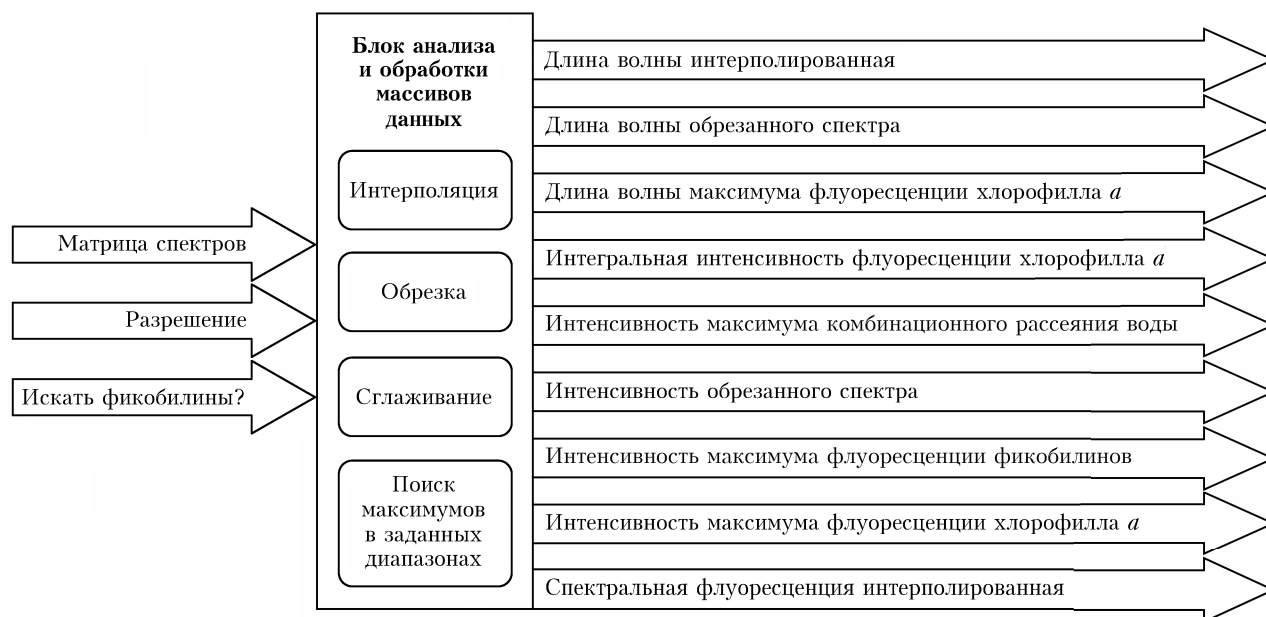
Рис. 3. Структура входной и выходной информации блока анализа и обработки полученных массивов данных

Основной исходной информацией для работы блока служит матрица спектров флуоресценции, полученная в ходе работы блока предварительной обработки. Кроме того, система дает исследователю возможность ввода трех дополнительных параметров.