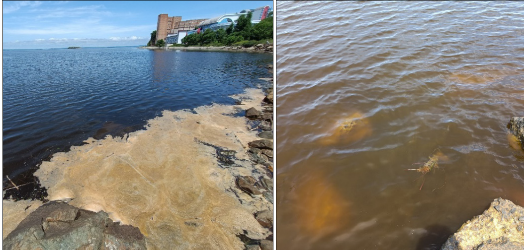
Рис. 1. Цветение микроводорослей 13.07.2022 г. в акватории Амурского залива