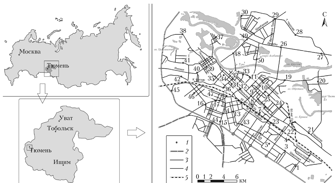
Рис. 1. Карта-схема района работ: 1 – точки измерений; 2 – дороги федерального значения; 3 – ТКАД (Тюменская кольцевая автомобильная дорога); 4 – дороги общегородского значения; 5 – железная дорога

Для оценки достоверности полученных результатов было проведено сравнение наших данных с данными по содержанию PM_{2,5} в других городах мира (таблица). Результаты сопоставимы практически для всех городов, за исключением Пекина и Агры, где содержание взвешенных частиц в несколько раз выше, что можно объяснить плохой экологической ситуацией в этих городах.