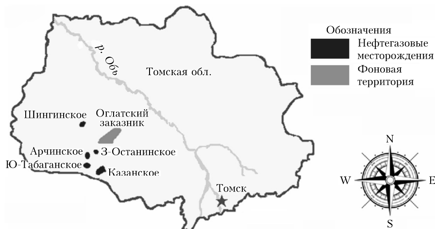
Рис. 1. Исследуемые территории

Для анализа динамики значений индекса EVI были сформированы продукты MOD13Q1 для 209-го календарного дня в году (28 июля), т.е. в результате 16-дневного усреднения дистанционных данных (13–28 июля) для каждого года. Расчет индекса EVI проведен с 2007 по 2017 г. за исключением 2015 г. из-за низкого качества данных.