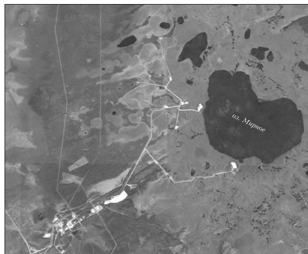
Рис. 3. Западно-Останинское месторождение

значение индекса является минимальным (0,2810) из всего массива данных табл. 1. В большей мере этот факт можно объяснить местоположением Западно-Останинского месторождения и особенностями его ландшафта (рис. 3): территория здесь сильно заболочена и имеет множество мелких озер, что способствует снижению EVI.