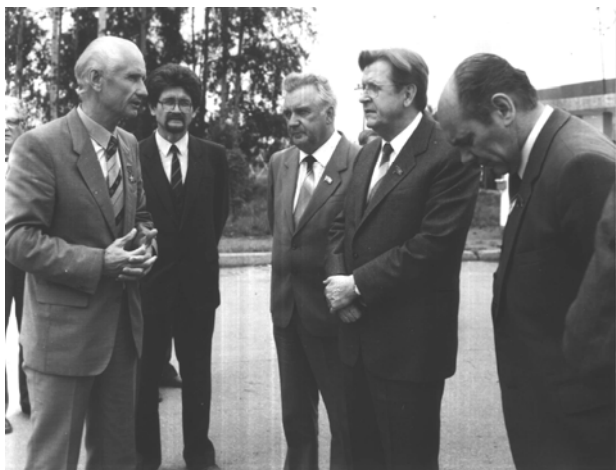
Визит в Томский академгородок Председателя Совета Министров СССР Виталия Ивановича Воротникова (1984 г.)

Создавая первый Томский академический институт и будучи вначале представителем Президиума СО АН СССР в Томске, а затем и председателем президиума Томского научного центра СО АН СССР, я отдавал себе отчет в том, что мой институт, несомненно, будет иметь перспективы комплексного развития только в условиях существования ряда других институтов центра. Напомню, что на первом этапе в Томске были открыты только два академических института – наш и Институт химии нефти. По этой причине уже при создании Института оптики атмосферы в его состав были включены подразделения «на вырост» в самостоятельные институты.