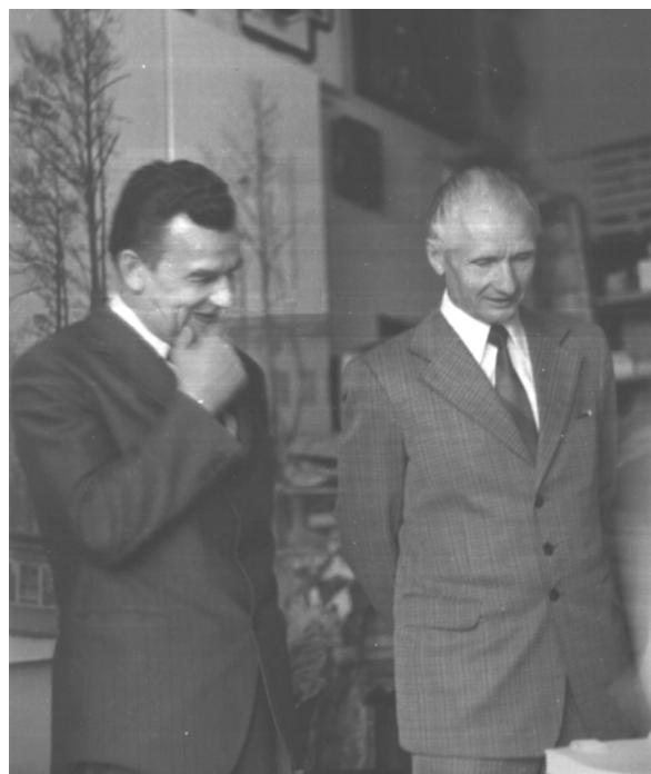
Председатель комиссии по проверке научной деятельности Института оптики атмосферы, ректор Московского университета, академик, лауреат Ленинской премии Рем Викторovich Хохлов во время работы по подведению итогов второй пятилетки (1979 г.)

На втором этапе созданы также оригинальные теории во всех основных научных направлениях современной оптики атмосферы, получены соответствующие результаты экспериментальных исследований, обобщенные в «Библиотеке монографий по современным проблемам атмосферной оптики», состоящей из 9 томов под моей общей редакцией.