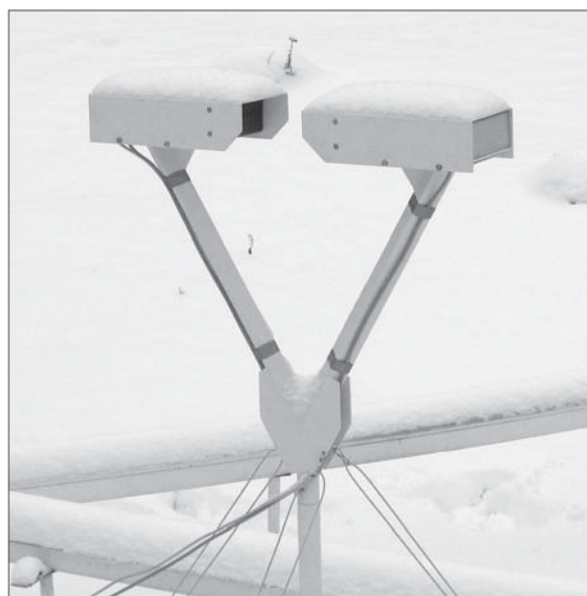
Рис. 2. Оптический осадкомер на метеорологической площадке ИМКЭС СО РАН

Для проведения натурных испытаний экспериментальный образец оптического осадкомера был установлен на метеорологической площадке ИМКЭС СО РАН (рис. 2).