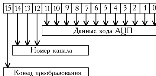
Рис. 2. Структура регистра данных и состояний комплекса

На рис. 2 показана структура регистра данных и состояний. Для повышения быстродействия в регистр данных введены флаги состояния устройства, которые занимают с 12-го по 15-й разряд. 12, 13, 14-й биты показывают номер канала, который оцифровывается в настоящий момент, а 15-й бит (знаковый) – на признак конца преобразования. Таким образом, удалось минимизировать количество обращений к АЦП комплекса при считывании данных информации и флагов состояния.