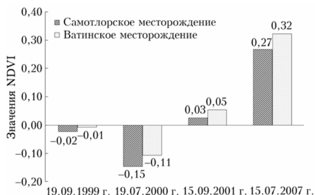
Рис. 2. Значения NDVI на загрязненных территориях изучаемых месторождений в период 1999–2007 гг.

Для количественной оценки состояния растительного покрова на территории разлива нефти Самотлорского и Ватинского месторождений исследования проводили в период с 1999 по 2007 г. На основе космических снимков Landsat рассчитывали значения нормализованного вегетационного индекса NDVI, которые отражают состояние нарушенной экологической системы. В красной области спектра находится максимум поглощения солнечной радиации хлорофиллом, в инфракрасной области спектра – максимум отражения клеточными структурами пластинки листа растений. Как правило, для подстилающей поверхности зеленой травяной растительности f_2 всегда больше f_1 , поэтому значения NDVI положительные и составляют 0,5–0,7, для разреженной растительности – 0,03, для погибшей при разливе нефти – минусовые значения (рис. 2). Следовательно, величина NDVI является интегральным показателем вегетационной активности наземной растительности после ряда мероприятий по очистке загрязненной территории.