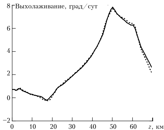
Рис. 3. Радиационные выхолаживания, полученные полинейным (—) и предлагаемым (· · ·) методами (10 каналов). Модель TRP, поглощения в линиях H 2 O и CO 2 , интервал 550–990 см -1

Как уже отмечалось в предыдущем разделе, анализ каналов, полученных для разных газов, позволяет достаточно просто получить каналы для смеси газов. Все это уже сейчас дает возможность разрабатывать эффективные параметризации радиации, например для климатических моделей. Об их качестве может дать представление рис. 3, где показано радиационное выхолаживание (град/сут) из-за поглощения в линиях CO 2 и H 2 O на интервале 550–990 см -1 . Как видно из рисунка,