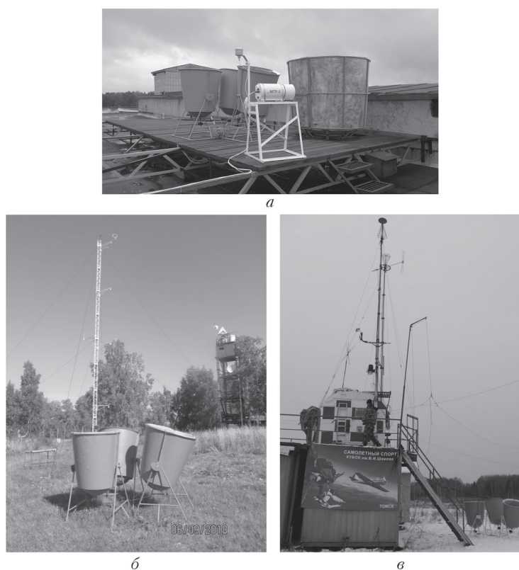
Рис. 2. Метеорологические измерители: а – в ИМКЭС СО РАН (содар «Звук-3» (три антенны на заднем плане), большой содар (одна антенна справа), температурный профилемер МТР-5); б – на полигоне ТУСУР (содар «Звук-3» (три антенны на переднем плане), многоуровневая 20-метровая метеомачта); в – на аэродроме в Головино (содар «Звук-3» (три антенны справа на земле), метеодатчики на мачтах)

Кроме того, АМК-03 обеспечивает измерение параметров турбулентности.