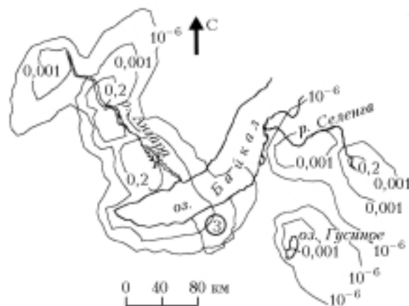
Рис. 3. Изолинии плотности массового расхода CuO на подстилающей поверхности региона Южного Байкала, \text{кг}/(\text{км}^2 \cdot \text{год})